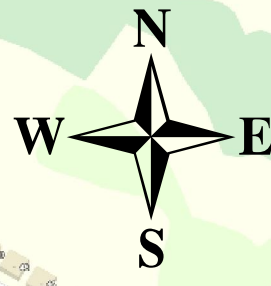
Схема водоснабжения Ардатовского городского поселения Ардатовского муниципального района Республики Мордовия